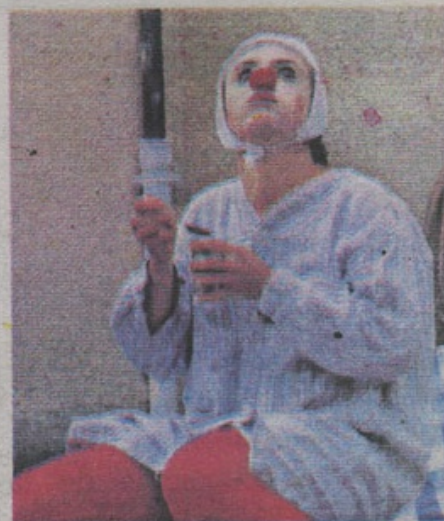
Cie Les insensés

"Tous les jours est un voyage" racontait en effet une journée de la vie de Maïone, une sans domicile fixe qui vit dans une extrême solitude. Solitude à laquelle elle tente d'échapper en se réfugiant dans le monde secret de son imagination. Monde secret où elle serait aimée et où quelqu'un se soucierait d'elle et lui donnerait des nouvelles. Pour les adultes, le personnage est donc moins bouffon et plus pathétique, et même touchant, voire poignant. "Les enfants ne voient pas la profondeur qu'il y a derrière