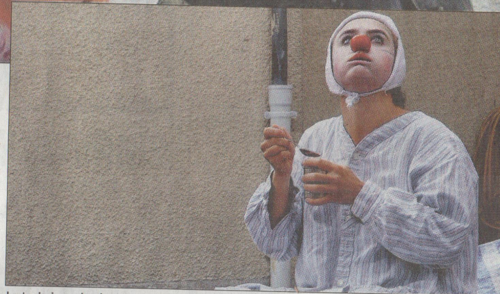
La technique du clown pour incarner Maïone, SDF touchante

Demain à 21 heures, spectacle pour tout public, conseillé à partir de 7 ans, au café-théâtre Don Carlo, rue du Boulodrome à Saint-Agrève. Tarifs 10 et 5 euros. Réservations 04 75 30 60 71.